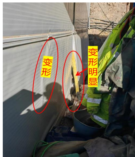
图5 值班室的窗户（外面已破碎） 图6 现场彩钢房发生明显变形图