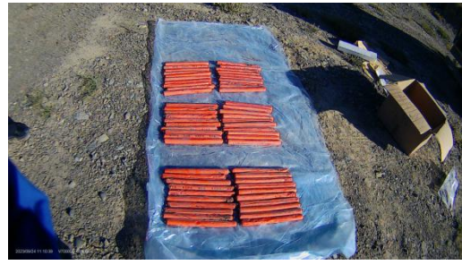
图 8 剩余炸药临时存放民用爆炸物品专用运输车 图 9 事故剩余炸药60卷(共18kg)