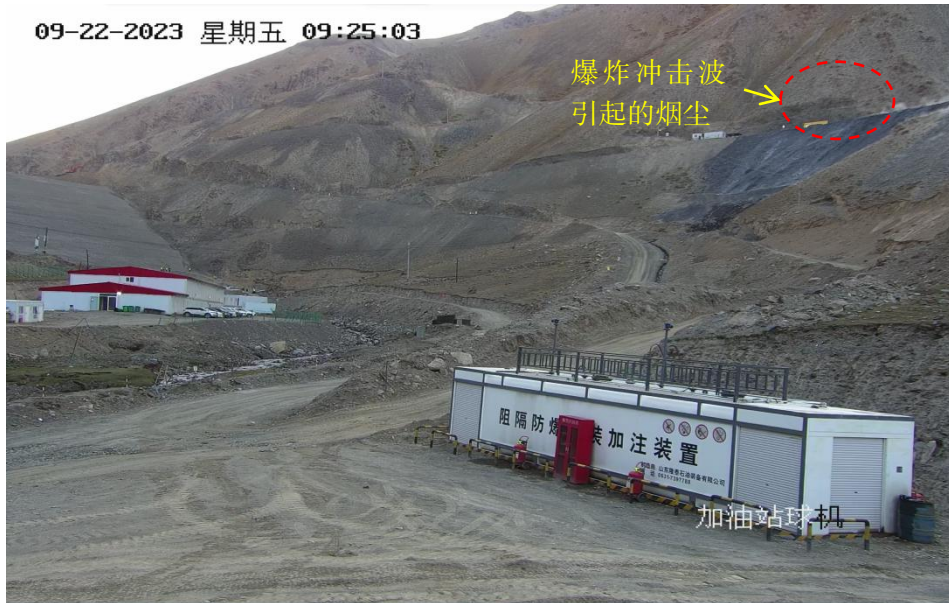
图7 紫金建设项目部视频监控截图

经查看紫金建设项目部视频监控存储录像，9月22日09时14分，回填平台西侧边缘有白烟冒起，持续至09时25分发生爆炸，出现冲击波（图7）。经核实视频监控时间较北京时间快7分钟，爆炸发生时间实际为09时18分。