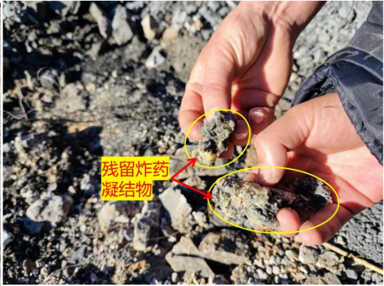
图3 疑似乳化炸药的凝结物